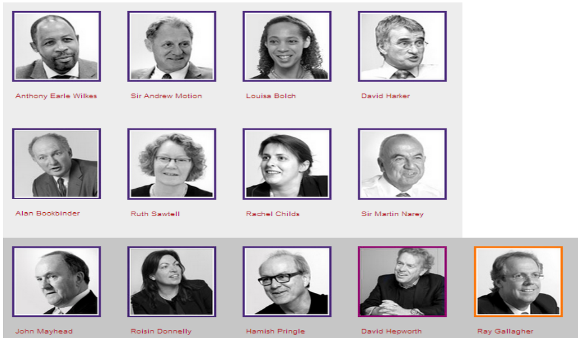
คณะกรรมการ 13 คน ของ ASA ในปัจจุบัน