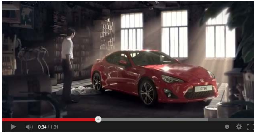
TOYOTA GT86: The Real Deal Advert - Full Version.