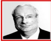
Rt Hon Lord Smith of Finsbury