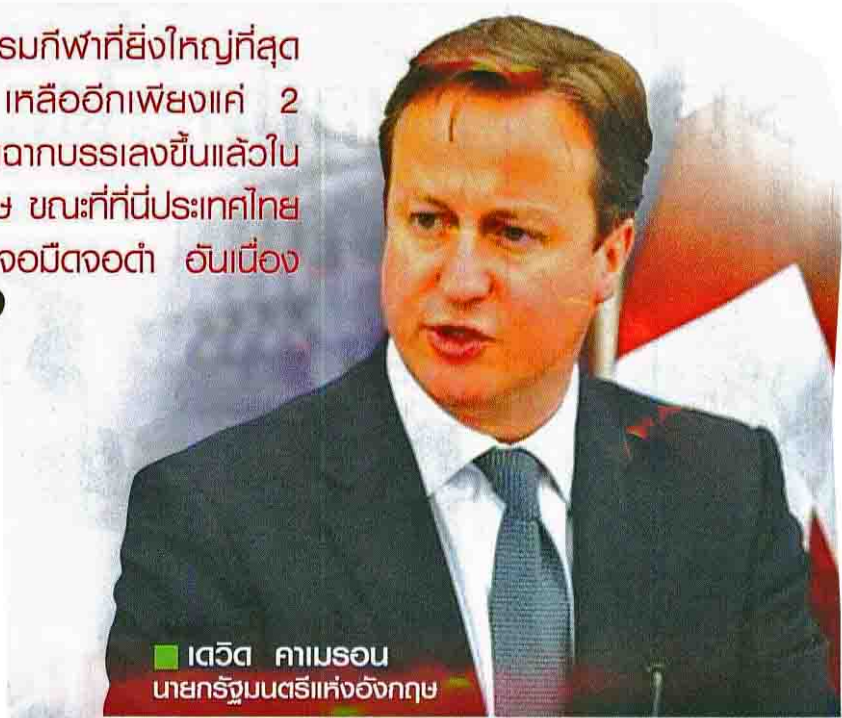
■ เดวิด คาเมรอน นายกรัฐมนตรีแห่งอังกฤษ

“นับเวลาก่อนการแข่งขันไปสู่มหกรรมกีฬาที่ยิ่งใหญ่ที่สุดของมวลมนุษยชาติครั้งล่าสุด เหลืออีกเพียงแค่ 2 สัปดาห์เท่านั้น ทุกอย่างก็จะเป็นไปตามที่เรารู้กันแล้วในมหานครลอนดอน ประเทศอังกฤษ ขณะที่ประเทศไทยยังคงงอแงพะอ่ะพะอยู่เกี่ยวกับปัญหาจอบีตจอต้า อันเนื่องมาจากลิขสิทธิ์การถ่ายทอดสด ”