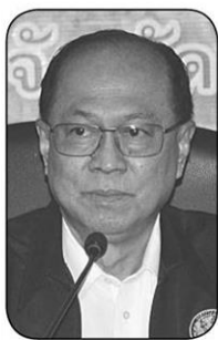
พล.อ.อนุพงษ์ เผ่าจินดา