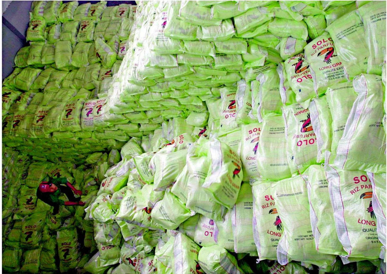
A labourer arranges thousands of sacks of rice inside a ship at Klong Toey port in Bangkok. Economists are warning the government about the ruinous rice pledging scheme and the adverse effects of other populist policies.

This is clearly demonstrated with a recent comment by Ms Yingluck when she was asked if she had a personal conflict with Thaksin in the upcoming cabinet reshuffle. She categorically denied the rumour, which Post Today interpreted to mean that the opposition would not succeed in trying to drive a wedge between the Big Boss and his "clone".