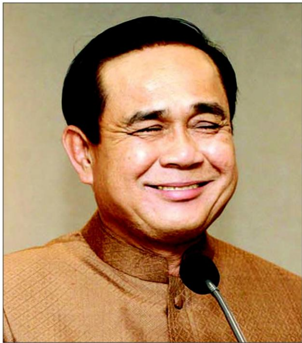
• พล.อ.ประยุทธ์ จันทร์โอชา