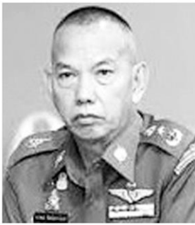
พล.ต.ท.วรวัฒน์ วัฒนนครบัญชา