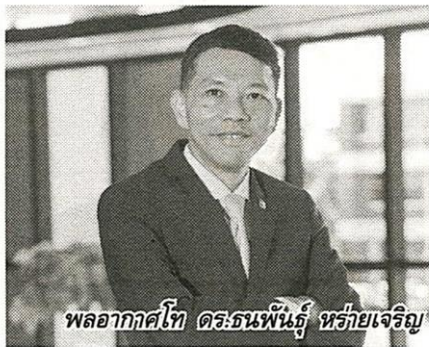
พลอากาศโท ดร.ธนพันธุ์ ทรัพย์เจริญ

ทั้งนี้เงื่อนไขสำหรับกิจการบริการสาธารณะ และการบริการชุมชนนั้น ต้องมีคุณสมบัติ