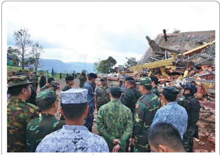
ป่วนแหวก - คณะผู้สังเกตการณ์ชั่วคราว หรือ IOT จาก 8 ประเทศสมาชิกอาเซียน ได้แก่ บรูไน มาเลเซีย สปป.ลาว อินโดนีเซีย เมียนมา ฟิลิปปินส์ สิงคโปร์ และเวียดนาม เดินทางลงพื้นที่ช่องอานม้า อ.น่ายัน จ.อุบลราชธานี เพื่อตรวจสอบการรุกเข้ามาในแผ่นดินไทย ได้ถูกทหารกัมพูชาเข้ามาคัดค้าน สร้างความปั่นป่วน และแสดงความไม่พอใจ

ผู้จัดการรายวัน360° - “ภูมิธรรม” ย้ำฟ้อง 2 ฟอลลูกสุน ยังใช้ศาลไทย แต่ไม่ปิดทางฟ้อง “อาชญากรรมสงคราม” ต่อศาลโลก “สุน เชน” โวยป่าเถื่อน ไม่รู้กฎหมาย การทูต ลั่นถ้าไทยจับผู้นำกัมพูชาได้ กัมพูชาก็จับผู้นำไทยบางคนได้ “ทวิ” เผยเสร็จกระบวนการ ก็ออกหมายจับ “มาริช” ยันทั้งฟ้อง ทั้งรักษาสัมพันธ์ รัฐบาลสั่ง