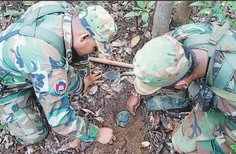
หลักฐานชัด ภาพที่ระบุว่ามาจากในโทรศัพท์มือถือที่ชุดเก็บกู้ กวาดล้างที่ 1 หน่วยปฏิบัติการทุ่นระเบิดเพื่อมนุษยธรรมกองทัพเรือ เก็บได้ในพื้นที่ภูมะเขือ จ.ศรีสะเกษ เมื่อนำมาตรวจสอบพบคลิปวิดีโอ และภาพถ่ายทหารกัมพูชาฝังทุ่นระเบิด PMN-2 ลงในดิน โดยภาพพระบ วันที่ถ่ายไว้ ถือเป็นหลักฐานชัดเจนถึงคนที่วางทุ่นระเบิด.

วงคณะผู้สังเกตการณ์ชั่วคราว (IOT) จาก 8 ชาติอาเซียม หวัดรุ่น ขณะดูจุดได้รับผลกระทบจากการโจมตีของกัมพูชา ที่ช่องอานม้า เจอทหารเขมรเข้ามาป่วนโวยวายลั่น อ้างสารพัด มาไม่แจ้ง พาคนมาเยอะเกิน ส่วนที่ฐานกฤษณา-ภูมะเขือ เพิ่งเก็บกู้ทุ่นระเบิดได้อีกลูกก่อนคณะ ★ มีต่อหน้า 12