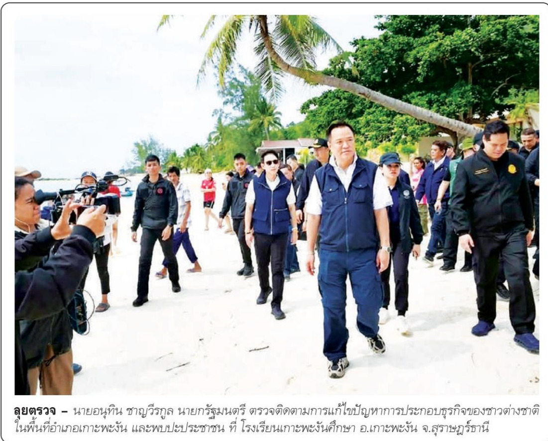
ลุยตรวจ - นายอนุทิน ชาญวีรกูล นายกรัฐมนตรี ตรวจติดตามการแก้ไขปัญหาการประกอบธุรกิจของชาวต่างชาติในพื้นที่อำเภอเกาะพะงัน และพบปะประชาชน ที่ โรงเรียนเกาะพะงันศึกษา อ.เกาะพะงัน จ.สุราษฎร์ธานี

วานนี้ (13 พ.ค.) พล.ต.อ.สำราญ นวลมา รอง ผบ.ตร. พร้อมด้วย พล.ต.นพ