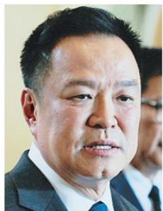
อนุทิน ชาญวีรกูล

โดยกิจกรรมจะมีขึ้น 6 ครั้งใน 5 ชาติ ตลอดเดือน พ.ค. เริ่มจากวันที่ 16 พ.ค. ที่จังหวัดอุบลราชธานี และจังหวัดสิงห์บุรี, วันที่ 17 พ.ค. ที่จังหวัดลำพูน และจังหวัดนครราชสีมา, วันที่ 24 พ.ค. ที่จังหวัดนครราชสีมา และวันที่ 31 พ.ค. ที่จังหวัดอุดรธานี ติดตามรายละเอียดเพิ่มเติมทางเฟซบุ๊ก https://www.facebook.com/Benfitthailand , ไลน์ https://www.instagram.com/Benfitthailand และติ๊กต็อก https://www.tiktok.com/@Benfitthai ■ ฟ้าคำราม socialfox@hotmail.com