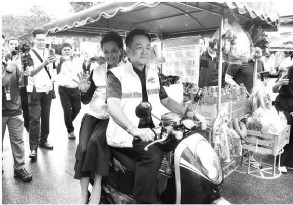
แต่จะเป็นแบบนี้หรือไม่ก็ต้องรอดู

หัวข้อข่าว: บทความพิเศษ: อนุทินโหมกส์กับการแก้เศรษฐกิจแบบรถพุ่มพวง