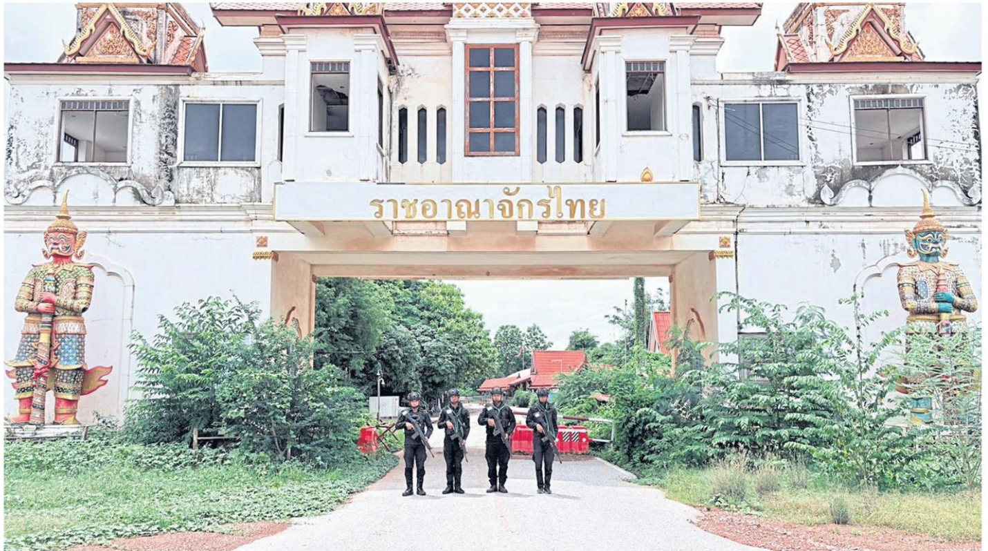
Royal Thai Army Rangers stand guard yesterday at a permanent border crossing point in Sa Kaeo province opposite Cambodia. BURAPHA TASK FORCE