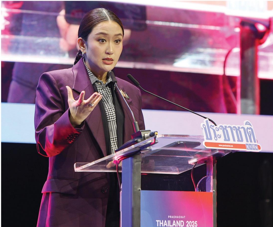
🏠 3 ทางรอด - น.ส.แพทองธาร ชินวัตร นายกรัฐมนตรี ปาฐกถาพิเศษ 'ประเทศไทย โอกาส ความจริง' ชู 3 ทางรอดประเทศไทย อาหาร สุขภาพ และอุตสาหกรรมสร้าง ซอฟต์แวร์พาวเวอร์ ในงาน PRACHACHAT THAILAND 2025 เมื่อวันที่ 21 พ.ย.

ดูย้อนหลังพบว่าเศรษฐกิจไทยโตช้าลงช้าลง เรื่อยๆ คิดว่าเศรษฐกิจไทยช่วงไตรมาส 3 ปีนี้เริ่มทำให้กระตุ้นเศรษฐกิจขึ้นมาได้บ้าง โดยเริ่มเห็นการเติบโตที่ระดับ 3% แต่จาก นี้ไปจะเติบโตอย่างไรคือปัญหาระดับชาติ ที่ต้องช่วยกันแก้ไขไม่ใช่ตั้งความหวังไว้กับ ใครคนใดคนหนึ่ง ปัจจุบันไทยจัดอยู่ใน สถานะประเทศที่มีรายได้ (จีดีพี) ประชากร ต่อหัวต่ำ และจีดีพียังต่ำอีกด้วย ทำให้ทุกวัน นี้ประเทศไทยจะเริ่มมีปัญหาเรื่องความ เหลื่อมล้ำมากขึ้นเรื่อยๆ เรื่องนี้ไม่ใช่ปัญหา ระดับชาติ แต่เป็นปัญหาระดับโลก เมื่อคน ที่เก่งมีอาวุธก็มีความรู้ มีเครื่องมือ เขาก็ จะพาตัวเองไปได้เร็วมากและจะทิ้งคนข้าง ล่างไว้ และเรื่องการใช้เทคโนโลยีปัญญา ประดิษฐ์ หรือ AI ก็เป็นอีกหนึ่งเครื่องมือ ถ้าใช้ดี คนข้างล่างอาจจะขึ้นมาสู่ได้ แต่ถ้า อยู่ในมือรายใหญ่เท่านั้น คนข้างล่างก็จะยิ่ง