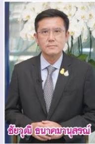
ชัยวุฒิ ธนาคมานุสรณ์

☆☆...ชูชิบบานเย็น ประจำวันอาทิตย์ที่ 27 พฤศจิกายน 2565 ...☆☆...ชัยวุฒิ ธนาคมานุสรณ์ รมว. ดิจิทัลเพื่อเศรษฐกิจและสังคม ได้โอกาสเป็นตัวแทนนายกรัฐมนตรีไปส่ง “ลีเซียน ลุง” นายกรัฐมนตรีสิงคโปร์ กลับบ้าน หลังประชุมเอเปค 2022 เสร็จสิ้น ที่สนามบินสุวรรณภูมิ เจ้าตัวบอกว่าทางนายกรัฐมนตรีสิงคโปร์ชื่นชมไทยจัดประชุมเอเปคได้ยอดเยี่ยม...ประทับใจ