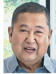
พลเอกเดชา เหมกระศรี