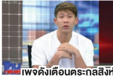
เพจดังเตือนตระกูลสิงห์