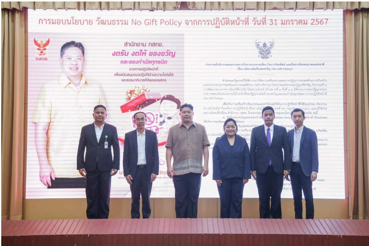
รายงานผลการดำเนินการป้องกันการทุจริตของสำนักงาน กสทช. ประจำปีงบประมาณ พ.ศ. ๒๕๖๗ สำนักสนับสนุนการตรวจสอบภายใน ติดตามประเมินผล และต่อต้านการทุจริต สำนักงาน กสทช.