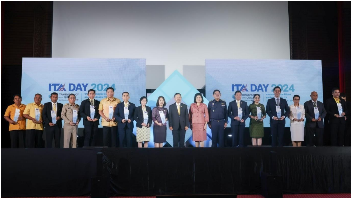
รายงานผลการดำเนินการป้องกันการทุจริตของสำนักงาน กสทช. ประจำปีงบประมาณ พ.ศ. ๒๕๖๗ สำนักสนับสนุนการตรวจสอบภายใน ติดตามประเมินผล และต่อต้านการทุจริต สำนักงาน กสทช.