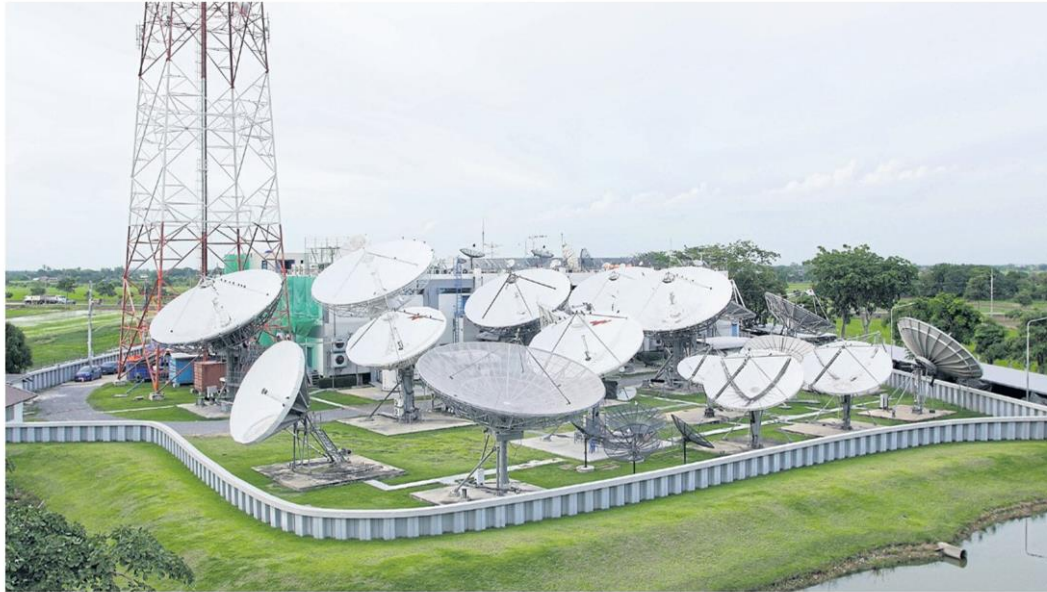
Satellite dishes at Thaicom Teleport & DTH Center in Pathum Thani. A Thaicom subsidiary is the likely winner of the right to use two satellite orbit slots.