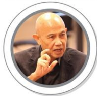
Suthichai Yoon veteran journalist