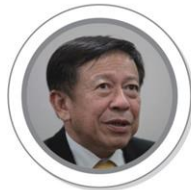
Pol Col Jarungvith Phumma secretary-general of the Election Commission.