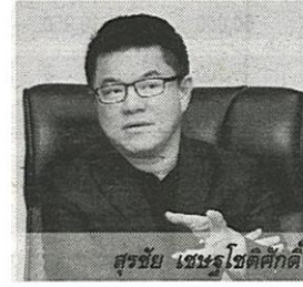
สรชัย เศรษฐกิจดี

หมายถึงไว้สูงถึง 3,500 ล้านบาท จึงค่อนข้างไกลเกินเอื้อม โดยนักวิเคราะห์คาดว่าปีนี้รายได้ของธุรกิจ MPC อย่างดีก็คงจะทำได้ 2,400 ล้านบาทเท่านั้น