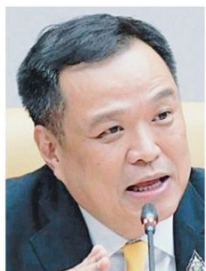
อนุทิน ชาญวีรกูล

ให้จบในปีที่ยังอยู่ในสัญญาเดิมก่อน แล้วจึงใช้ระบบใหม่เป็นลิขสิทธิ์ในวาระรอบใหม่ ที่คุยไว้ว่าจะเซ็นกันยาว 8 ปีโน่น ไปเริ่มในปีต่อไปดูจะลงตัวกว่า ก็ยังรอการแก้ปัญหาหระหว่าง ทูร์วิชั่นส์ กับสมาคม ว่าจะมีทางออกอย่างไร ■ ดูเหมือนจะเป็นภารกิจสุดท้ายของ จูกร ตันนาสิทธิ ในฐานะเลขาธิการ กกสทช. ในการลงนามบันทึกข้อตกลงร่วมสนับสนุนค่าใช้จ่ายซื้อลิขสิทธิ์กีฬา 5 รายการที่มี โอลิมปิกโตเกียว 2020 เป็นรายการแรก